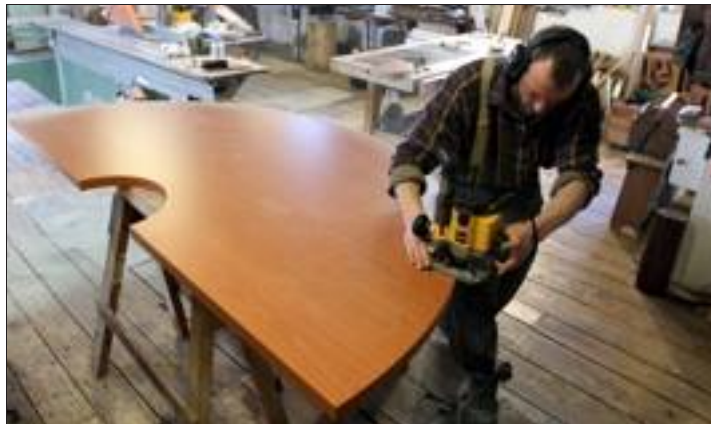
Dans l'atelier de menuiserie, Pierre-Marie réalise le nouveau plan de travail de la cuisine. L'étape suivante concerne les fenêtres.