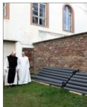
Ces nouveaux tuyaux sont destinés à l'assainissement.