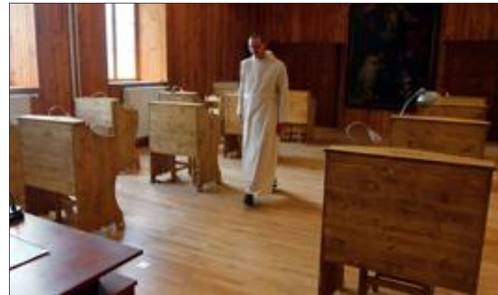
Dans le nouveau scriptorium, chaque frère dispose d'un équipement neuf en bois composé d'un bureau à son nom et d'une chaise.