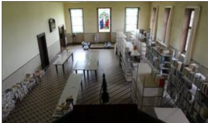
Vue de la salle de l'ancien réfectoire où régnait le froid. Elle abritera désormais la nouvelle bibliothèque des moines.