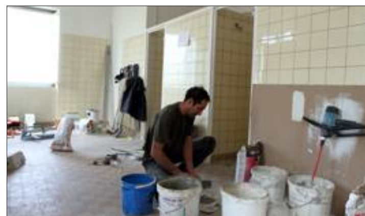
Le bloc sanitaire est en cours d'achèvement. Très bientôt, les moines utiliseront des nouvelles douches avec mitigeurs.