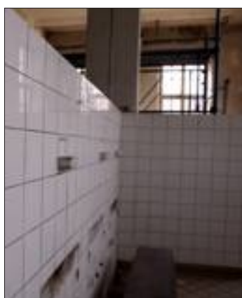
Le lavatorium va être une salle de repassage.

C'est le montant récolté avec la vente des livres et les dons.